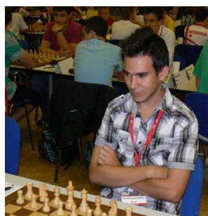
Figura en las listas con 2.553 puntos ELO. Se erigió en el primer murciano en lograr el título de Gran Maestro en 2012, mismo año que David Antón. Lo hizo en el Torneo de Gibraltar. Licenciado en Derecho, ha ganado los campeonatos de España sub 16 y sub 20 y en su palmarés figuran varios torneos de prestigio nacional, como el Villa de Roquetas o el Festival de Ajedrez Nazarí.